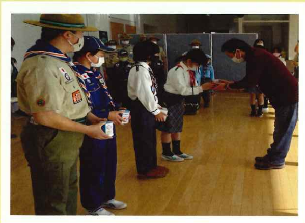
<猪苗代スカウト育成会>

10月より始まりました”赤い羽根共同募金運動の歳末たすけあい募金”へ猪苗代スカウト育成会、長瀬小学校、東中学校より募金活動へ集められた募金が寄託され、一方当協議会へは、(株)JA 会津よつば総合サービス、会津ヤクルト販売(株)よりご寄付を頂きました。 いただいた浄財は、地域福祉に有効活用させていただきます。 また、個人でいただいた方につきましては、次年度広報紙面にてご紹介させていただきます。 みなさんの善意ありがとうございました。(敬称略)