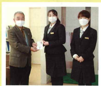
<(株)JA 会津よつば総合サービス>