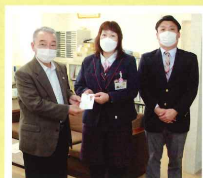
<会津ヤクルト販売(株)>