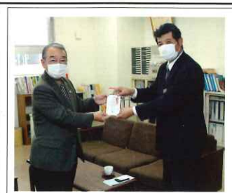
(株)JA 会津よつば総合サービス よつば催事センター