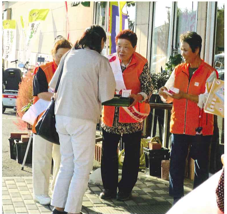
赤い羽根街頭募金 (ボランティア連絡協議会)