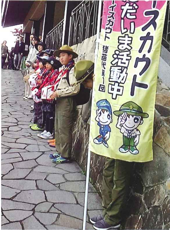
赤い羽根共同募金 (ボーイスカウト・ガールスカウト)