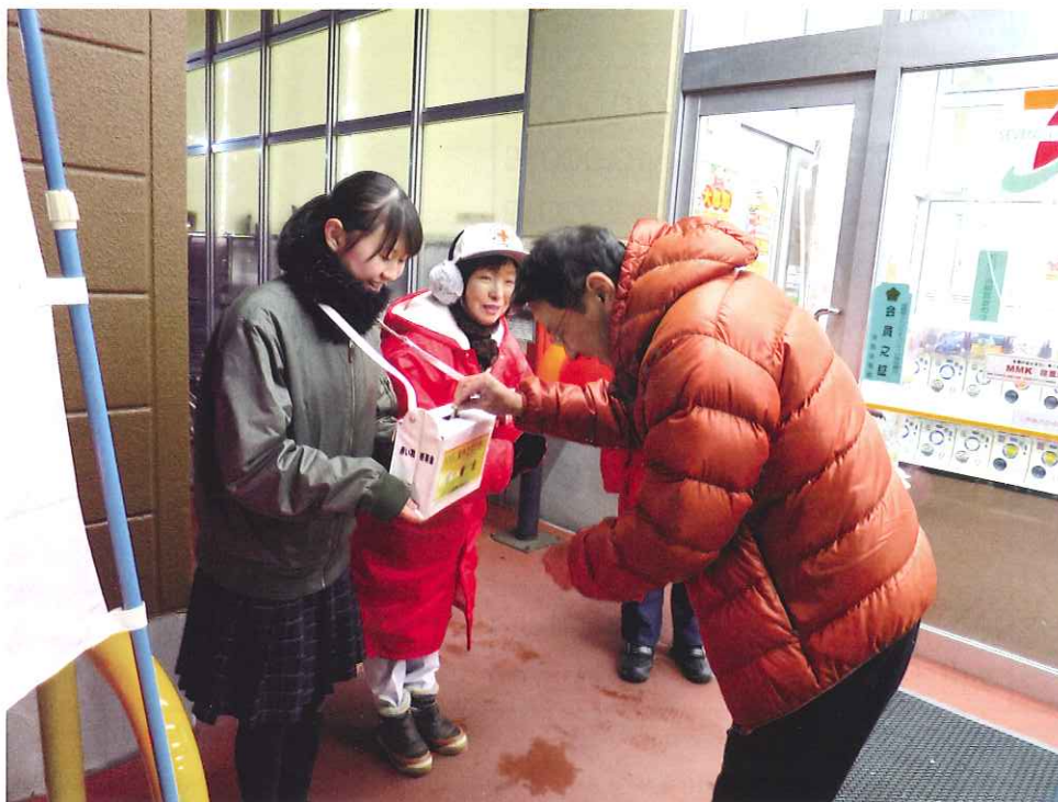
NHK 海外たすけあい街頭募金 (赤十字奉仕団、猪苗代高校 JRC)

昨年も10月から赤い羽根共同募金が、12月にはNHK海外助け合い募金が、リオン・ドル猪苗代店やヨークベニマル猪苗代店、ダイソー猪苗代店にご協力頂き、店頭にて街頭募金が行われました。 多くの皆様より募金のご協力ありがとうございました。 皆様のお気持ちは、子供たちや高齢者・障がいをお持ちの方々など、支援の必要な方々の為に使われます。