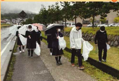
猪苗代高校 JRC インターアクト委員会