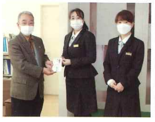
(株)JA 会津よつば総合サービス